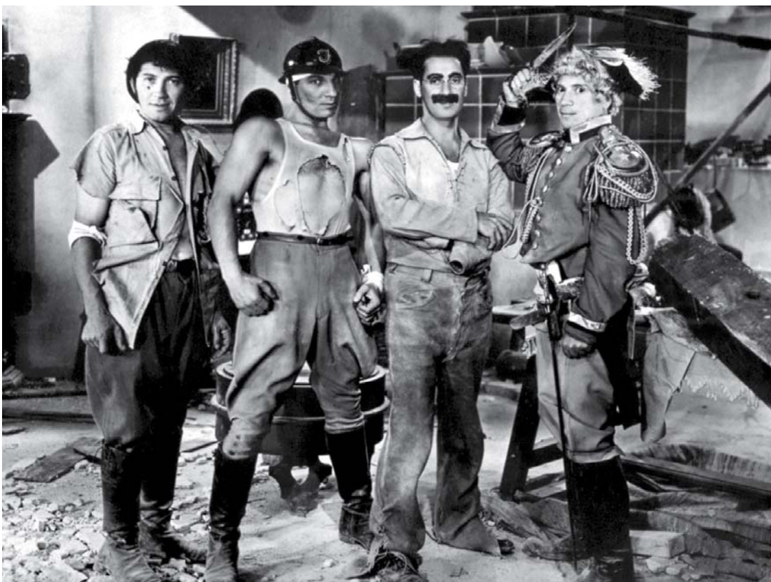
SOPA DE GANSO

guerra, los totalitarismos (ese mismo año Adolf Hitler llegaba al poder en Alemania)... De hecho, no gustó nada a Mussolini, que la prohibió, y el propio Hitler tampoco dejó que se estrenara en su país, no sólo por el argumento, sino por la prohibición absoluta de exhibir la obra de los hermanos Marx, en su condición de judíos.